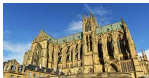
Cathédrale Saint-Etienne de Metz

Au niveau de la maison de l'éclusier, près du plan d'eau. Mais aussi à BLIIDA, le long de la Moselle, avec la vue sur la cathédrale. Le jardin botanique aussi !