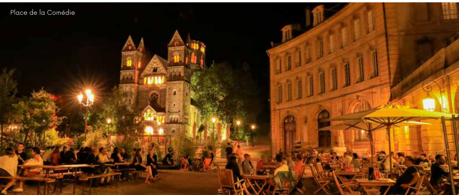
Place de la Comédie