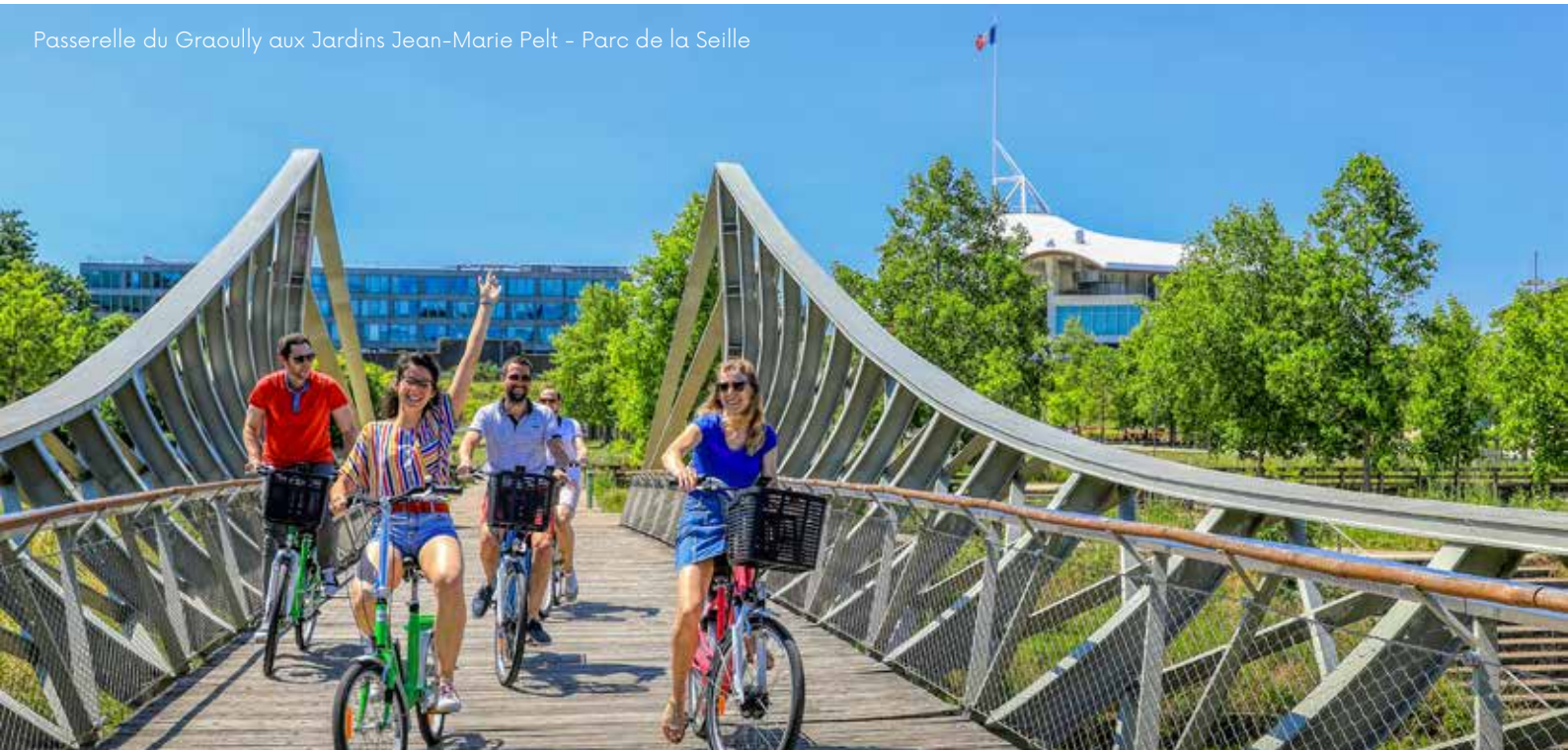
Passerelle du Graouilly aux Jardins Jean-Marie Pelt – Parc de la Seille

Pour moi, le charme de Metz se résume dans le contraste entre le centre historique et le quartier impérial, entre l'une des plus vieilles églises et la plus belle gare de France. J'aime beaucoup les abords de la cathédrale et le marché couvert, mais mon endroit préféré reste le Centre Pompidou-Metz, pour son architecture merveilleuse et pour sa programmation ouverte à tous.