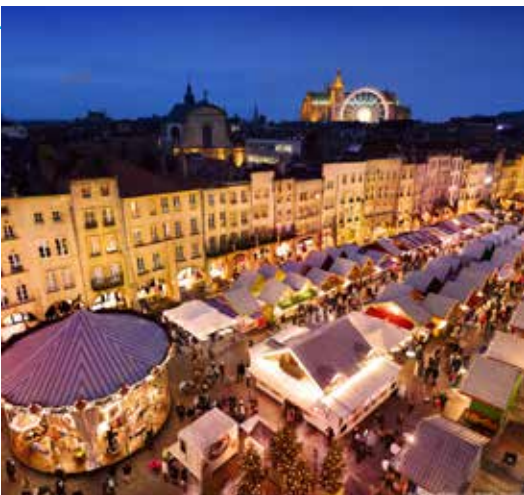
Marchés de Noël de Metz, place Saint-Louis